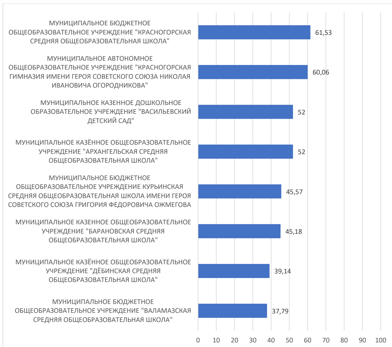
Рисунок 3 – Рейтинг организаций по критерию «Доступность образовательной деятельности для инвалидов»

По третьему критерию «Доступность образовательной деятельности для инвалидов» максимальный результат 61,53 балла набрало МУНИЦИПАЛЬНОЕ БЮДЖЕТНОЕ ОБЩЕОБРАЗОВАТЕЛЬНОЕ УЧРЕЖДЕНИЕ "КРАСНОГОРСКАЯ СРЕДНЯЯ ОБЩЕОБРАЗОВАТЕЛЬНАЯ ШКОЛА".