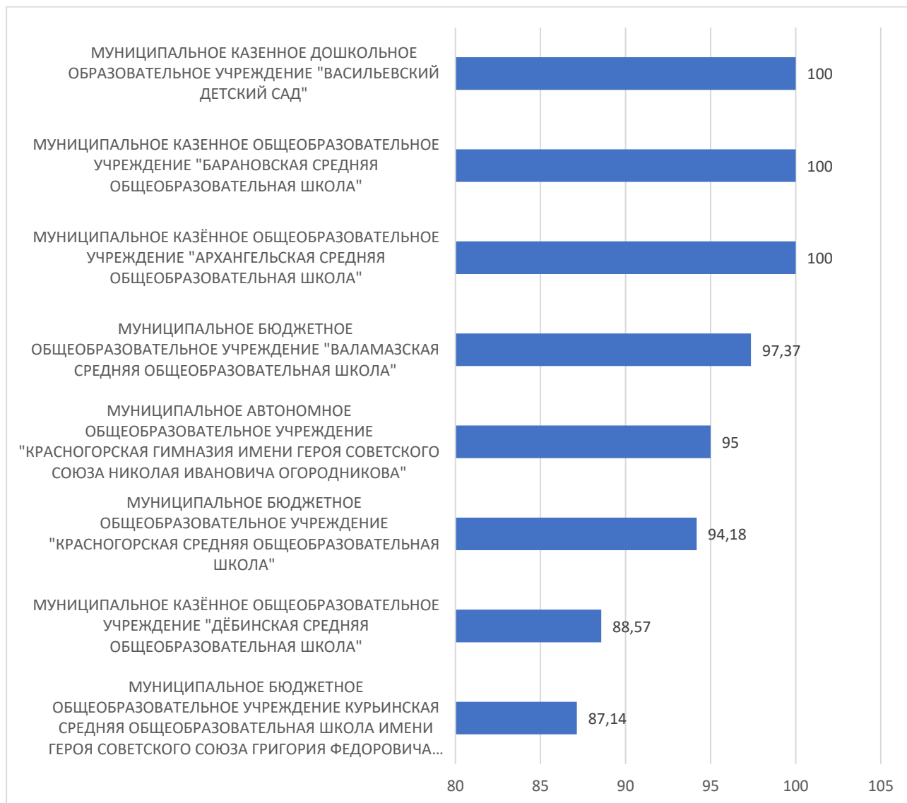
Рисунок 5 – Рейтинг организаций по критерию «Удовлетворенность условиями осуществления образовательной деятельности организаций»

По пятому критерию «Удовлетворенность условиями осуществления образовательной деятельности организаций» максимальный результат 100 баллов набрали три организации: МУНИЦИПАЛЬНОЕ КАЗЁННОЕ